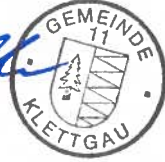
Ozan Topcuogullari Bürgermeister