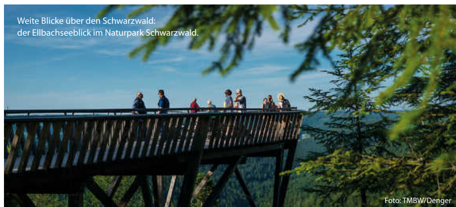
Weite Blicke über den Schwarzwald: der Ellbachseeblick im Naturpark Schwarzwald.

Schon von Weitem ist der Aussichtsturm im Naturpark Schönbuch zu sehen. Die 35 Meter hohe Holz-Stahl-Konstruktion auf dem Stellberg ragt weit über die umliegenden Bäume im ältesten Naturpark Baden-Württembergs hinaus. 348 Stufen erschließen den filigranen Turm und führen zu drei Aussichtsplattformen in 10, 20 und 30 Metern Höhe. Ganz oben kann man nicht nur dem Schönbuch auf sein Blätterdach schauen; auch die Schwäbische Alb und der Schwarzwald erscheinen von hier zum Greifen nah. (TMBW/red)