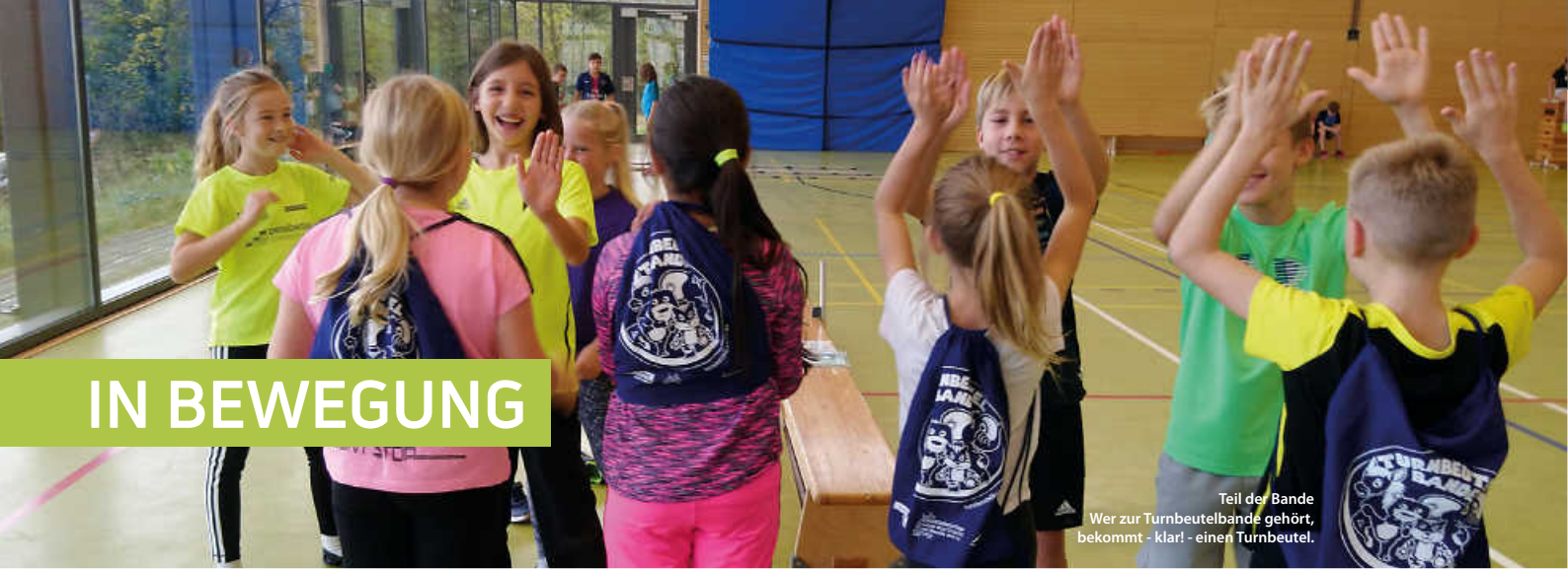
Teil der Bande Wer zur Turnbeutelbande gehört, bekommt - klar! - einen Turnbeutel.