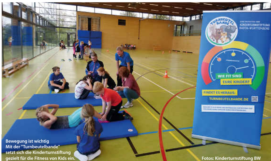
Bewegung ist wichtig Mit der „Turnbeutelbande“ setzt sich die Kinderturnstiftung gezielt für die Fitness von Kids ein.

Übrigens: Für die fünf ersten Kommunen, die den Motorik-Test für Kinder bei sich durchführen wollen, bietet die Kinderturnstiftung Baden-Württemberg eine kostenlose digitale Schulung an. Im Rahmen der etwa zweistündigen Veranstaltung wird der Test vorgestellt und es werden Tipps zur erfolgreichen Organisation und Durchführung gegeben, Kontakt hier: info@turnbeutelbande.de (pm/red)