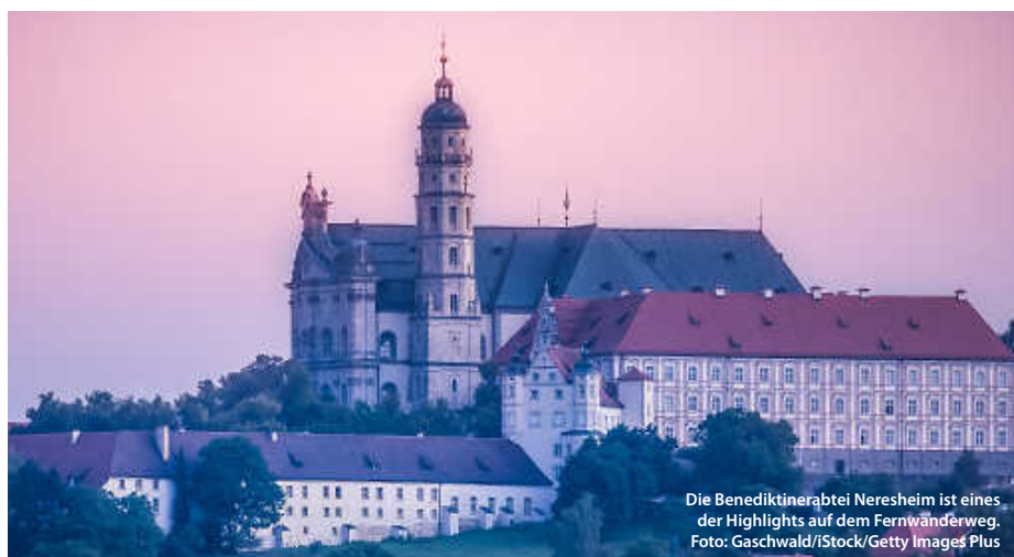
Die Benediktinerabtei Neresheim ist eines der Highlights auf dem Fernwanderweg.

Und natürlich warten überall Schafe: Heute noch bewirtschaftete Schafhöfe, uralte Schaftriebe, die Kultur des Schäferlaufes – sie alle geben spannende Einblicke in die Kultur der Schäfer, die die Region bis heute einzigartig und vor Ort erlebbar machen. (haf/jr)