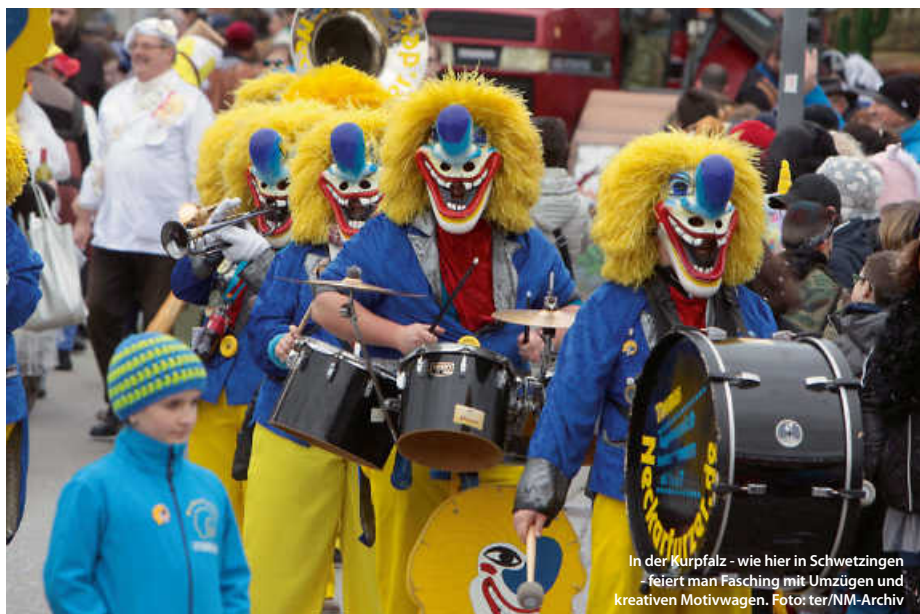
In der Kurpfalz – wie hier in Schwetzingen – feiert man Fasching mit Umzügen und kreativen Motivwagen.

Geht der Tag dann seinem Ende zu, heißt es Abschied nehmen. Besonders zelebriert wird das zum Beispiel in Bad Waldsee. Wenn die Schrättle ihre Besen verbrennen, wird die verblichene Fasnet in Form einer Strohuppe unter lautem Klagen den Fluten des Schlossbachs übergeben. Andernorts wird sie beerdigt. Am Aschermittwoch ist dann alles vorbei – fast, denn jetzt heißt es, Geldbeutel waschen, die närrischen Tage haben die Börse geleert. Da bleibt nur noch die Rückgabe des Rathauschlüssels und Fasten – ganze 40 Tage, bis Ostern. (jr/red)