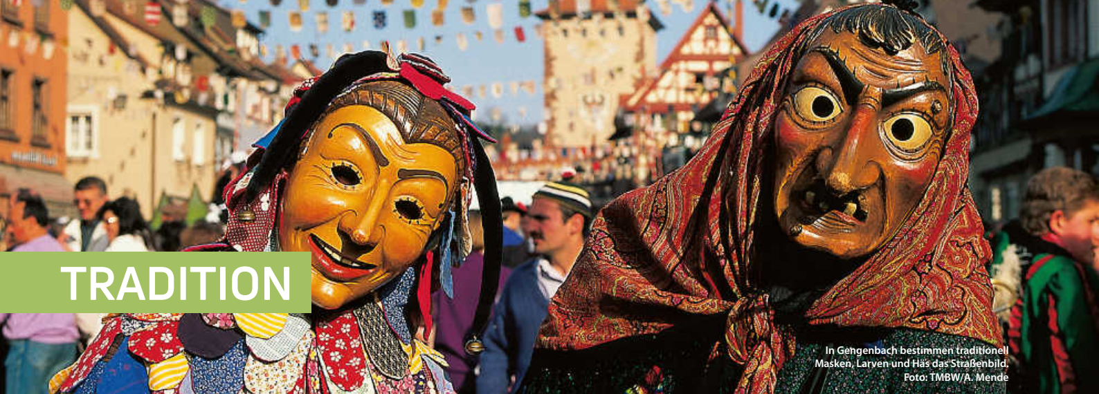
In Gengenbach bestimmen traditionell Masken, Larven und Häas das Straßenbild.