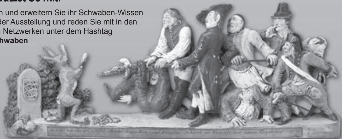
Die Sieben Schwaben, Anton Sohn, 1830–31

Erproben und erweitern Sie ihr Schwaben-Wissen aktiv in der Ausstellung und reden Sie mit in den Sozialen Netzwerken unter dem Hashtag #ImwSchwaben