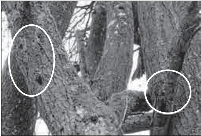
Wie Wilhelm Busch schon wusste: "Alte Bäume behämmert der Specht am meisten".